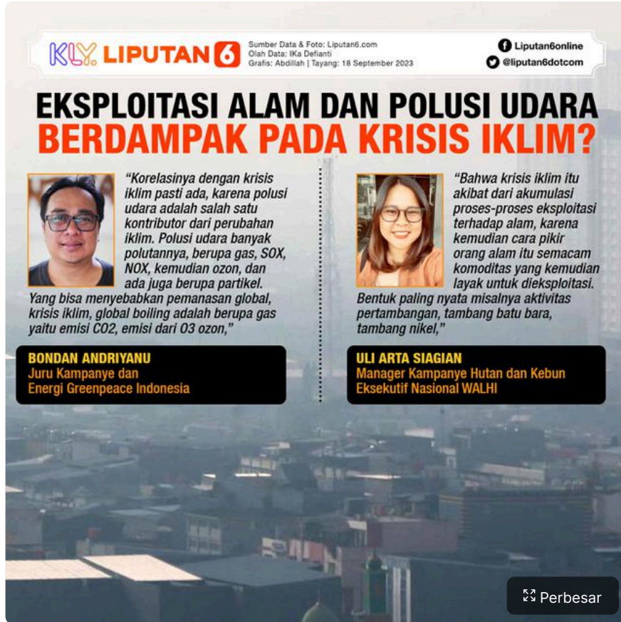
INFOGRAFIS JOURNAL_ Eksploitasi Alam dan Polusi Udara Berdampak pada Krisis Iklim?