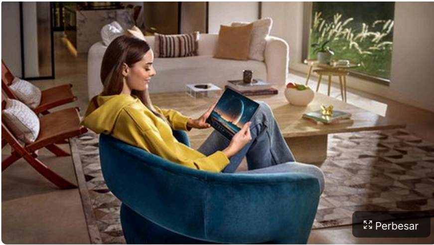
Huawei MatePad Pro 13.2, tablet dengan desain tipis, ringan, dan elegan untuk kreasi tanpa batas dan pengalaman lebih dari laptop. (Huawei)