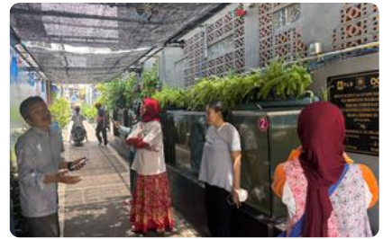
Kepala Sekolah Indonesia Berkebudun Kunjungi dan Apresiasi Media Percontohan Pencegah Krisis Planet di Malaka Jaya