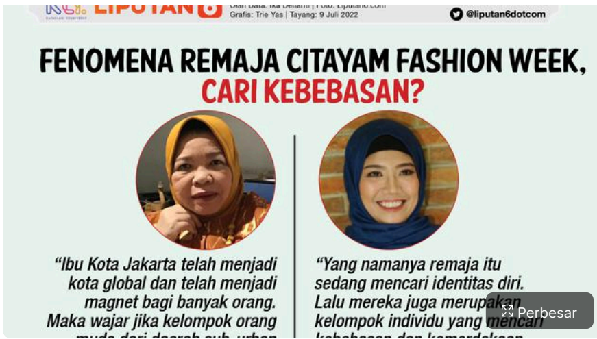
Infografis Journal Fenomena Remaja Citayam Fashion Week, Cari Kebebasan?.. (Liputan6.com/Trie Yasni)

Dalam buku "Creating Infographics with Adobe Illustrator" disebutkann sebelum memutuskan jenis infografik apa yang akan dibuat, penting memiliki pemahaman jelas mengenai apa itu infografik secara tepat dan bagaimana ia menyampaikan informasi secara grafis." Dengan definisi tersebut, desainer dapat menentukan apakah menggunakan ilustrasi, diagram statistik, atau elemen visual lain untuk menjawab tujuan tertentu